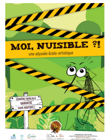
Moi, nuisible ?! (création 2023) Théâtre Jeune Public