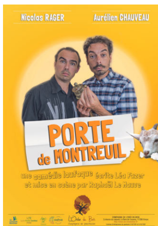
Porte de Montreuil (création 2018) Théâtre Tout Public